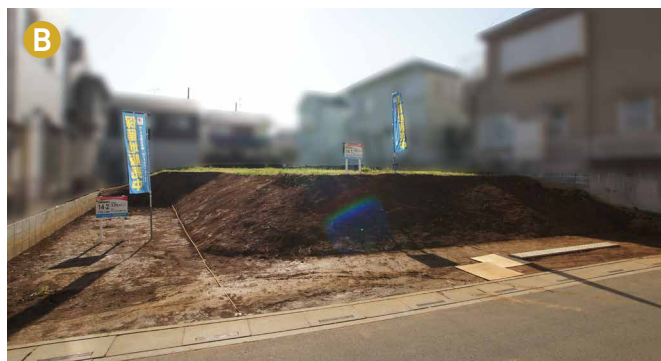
現地写真は2018年11月21日撮影