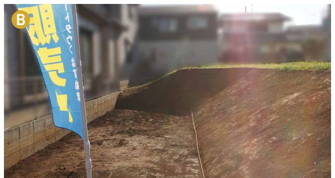
現地写真は2018年11月21日撮影