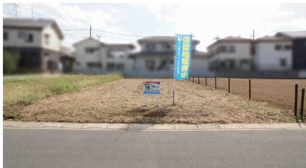
現地写真は2018年10月10日撮影

※地積の坪数及び1坪当たりの単価(千円)は、1m²=0.3025坪で換算した概数です。坪数は小数点以下切り捨て、1坪当たりの単価は100円単位を切り捨てて表記しています。 ※販売区画図と現況が異なる場合は、現況を優先させていただきますので、現地を十分ご確認ください。