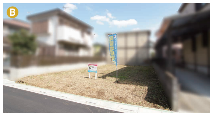
現地写真は2018年10月10日撮影