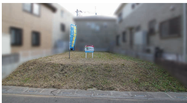
現地写真は2018年10月10日撮影

※販売区画図と現況が異なる場合は、現況を優先させていただきますので、現地を十分ご確認ください。