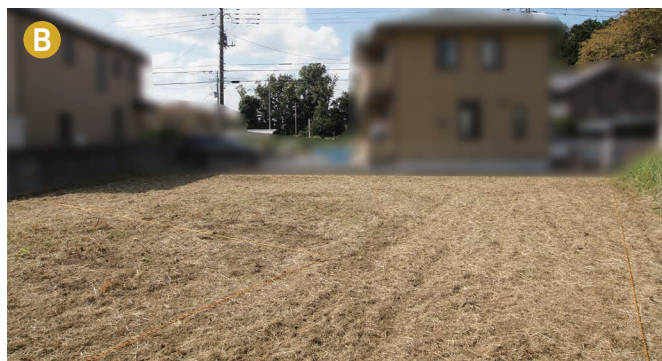
現地写真は2018年10月10日撮影