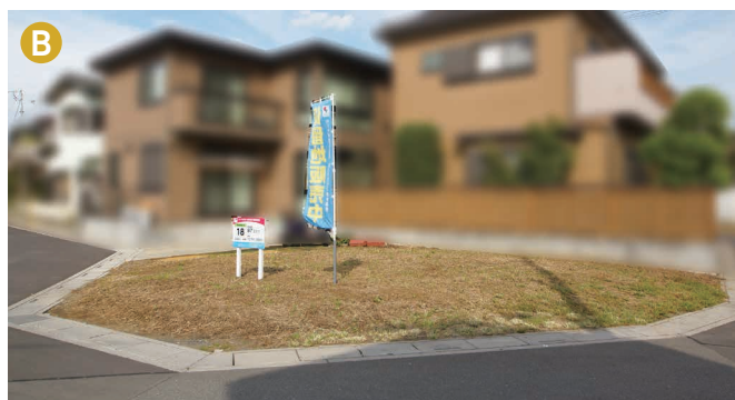
現地写真は2018年10月10日撮影