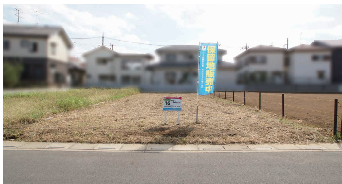
現地写真は2018年10月10日撮影

※地積の坪数及び1坪当たりの単価(千円)は、1㎡=0.3025坪で換算した概数です。坪数は小数点以下切り捨て、1坪当たりの単価は100円単位を切り捨てて表記しています。 ※販売区画図と現況が異なる場合は、現況を優先させていただきますので、現地を十分ご確認ください。